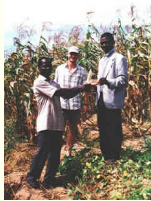
Foto: Eine reiche Ernte gibt es in diesem Jahr nicht in Malawi. Die Einwohner sind vom Hunger bedroht.

Konto-Nr. 905 333 600, Volksbank Tecklenburger Land, BLZ 403 619 06.